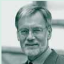
Die Forschungsgruppe Effiziente Algorithmen im Berichtsjahr 2006:

In der folgenden Übersicht über die Forschungsprojekte sind jeweils die Mitarbeiter genannt, die neben dem Leiter der Forschungsgruppe mit wesentlichen Beiträgen an dem jeweiligen Projekt beteiligt sind.